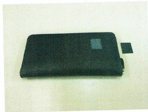
図 2 試験片の採取箇所および試験片の写真