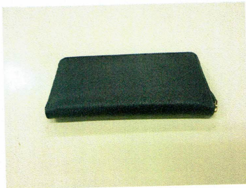
図 1 提出されたサファイアーレザーを使用したトラベルケース（saffitravelcase）の写真

図 1 に提出されたサファイアーレザーを使用したトラベルケース（saffitravelcase）の写真を、図 2 に試験片の採取箇所および試験片の写真を示す。また、標準試料として、当所所有の天然皮革（牛革）を用いた。