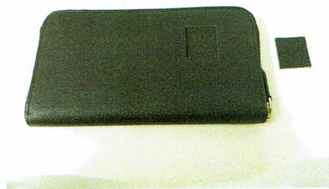
図 2 試験片の採取箇所および試験片の写真