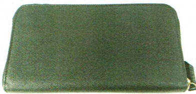
図 1 提出されたサファイアーノレザー ラウンドファスナー長財布（sffiround）の写真

図 1 に提出されたサファイアーノレザー ラウンドファスナー長財布（sffiround）の写真を、図 2 に試験片の採取箇所および試験片の写真を示す。また、標準試料として、当所所有の天然皮革（牛革）を用いた。