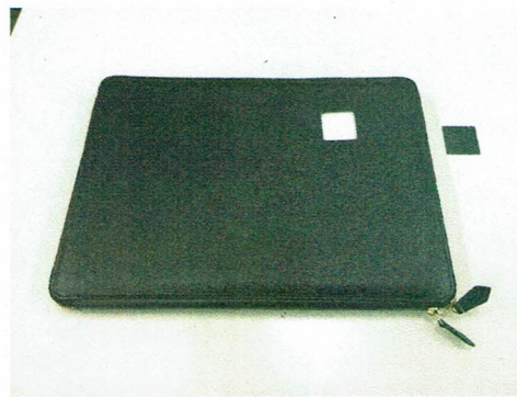
図 2 試験片の採取箇所および試験片の写真