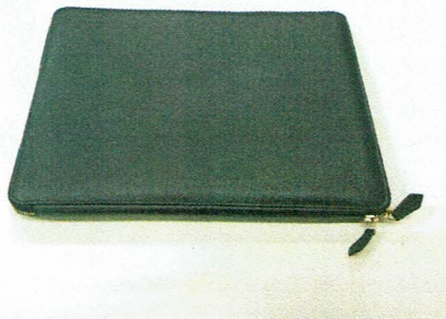
図 1 提出されたサフィアーノレザーを使用した MacBook ケース（saffimacbook）の写真

図 1 に提出されたサフィアーノレザーを使用した MacBook ケース（saffimacbook）の写真を、図 2 に試験片の採取箇所および試験片の写真を示す。また、標準試料として、当所所有の天然皮革（牛革）を用いた。