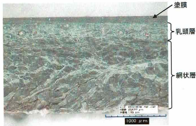
図3 試験片の表面に対して垂直方向の断面写真

図3に提出された試料の表面に対して垂直方向の断面写真を示す。試料の表側（写真の上側）から順に、塗膜、乳頭層、網状層が観察されている。図4に示した天然皮革（牛革）標準試料の断面と類似した構造を示しており、提出された英国王室御用達レザーであるブライドルレザーを使用したメンズ札入れ長財布の外側に使用されている素材は天然皮革であると推定される。