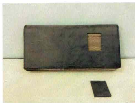
図 2 試験片の採取箇所および試験片の写真