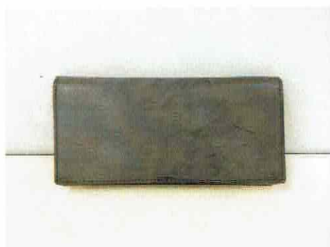
図 1 提出された英国王室御用達レザーであるブライドルレザーを使用したメンズ札入れ長財布の写真

図 1 に提出された英国王室御用達レザーであるブライドルレザーを使用したメンズ札入れ長財布の写真を、図 2 に試験片の採取箇所および試験片の写真を示す。また、標準試料として、当所所有の牛革を用いた。